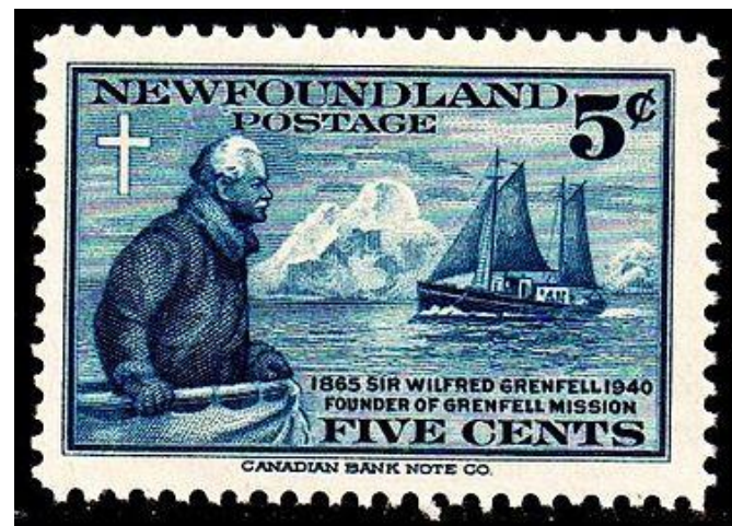
Марка Канады, посвящённая сэру Уилфреду Гренфеллу. 1941 г.

Уилфред Гренфелл говорил: «Для меня теперь любое служение самому униженному из рода человеческого – это служение Христу <...> Следование за Христом позволило мне иметь больше приключений, чем любой другой образ жизни».